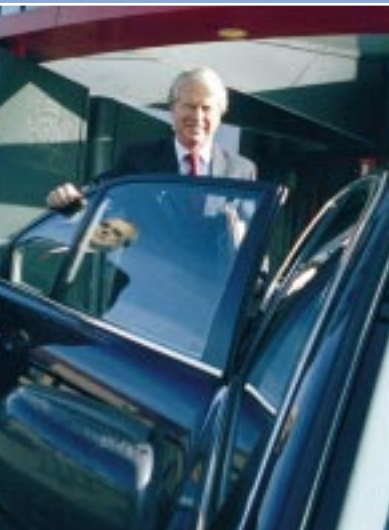
Commissaris van de koningin