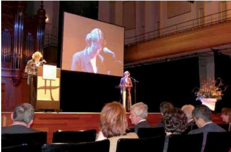
De aanwezigen luisteren geduldig naar de moties van PerspectieF

Op zaterdag 31 januari was het ChristenUnie partijcongres. Voor PerspectieF is dat een mooie gelegenheid om nieuwe dingen aan de orde te brengen. Deze keer stonden Europa, Irak en onderwijs centraal. 's Morgens kwam het Europees verkiezingsprogramma aan de orde. Daarop had PerspectieF een vijftal amendementen (aanpassingvoorstellen) ingediend. Twee van de vijf werden uiteindelijk overgenomen door het bestuur. Naast de amendementen had PerspectieF ook een motie over de aansluiting van de ChristenUnie bij de Europese Volkspartij (EVP) in het Europees Parlement waar vanuit Nederland ook het CDA in zit. Ook die motie werd overgenomen.