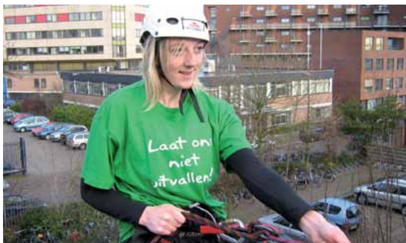
EH-studenten springen tegen uitval Hoger Onderwijs, ook de bestuursleden van perspectieF wagen de sprong.