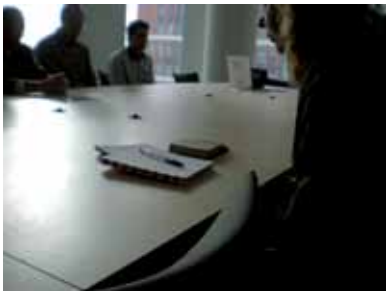
Bidden op het Ministerie van OC&W

Het beleid van het bedrijf ten aanzien van de groep wordt steeds strenger. "De eerste twee jaar piepte niemand over de posters die we als gebedsgroep ophingen", zo verklaart Jaap, een