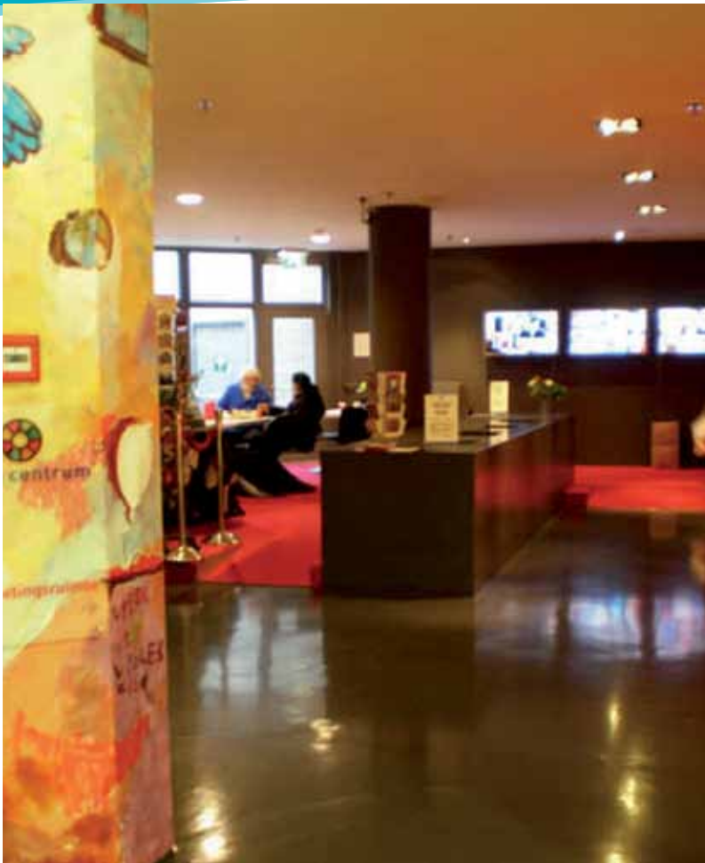
Zoek de stilte in het Stillecentrum op Utrecht Centraal

nodig hebben. Opvallend is de plaats die er in de verschillende gebeden is voor dankzegging. Ze danken God voor wie Hij is en voor Zijn grootheid. Een medewerkster van het Ministerie van Justitie bidt tijdens het gebed van iemand anders, prevelend mee in zichzelf: “Jesus, Jesus, thank You Jesus”.