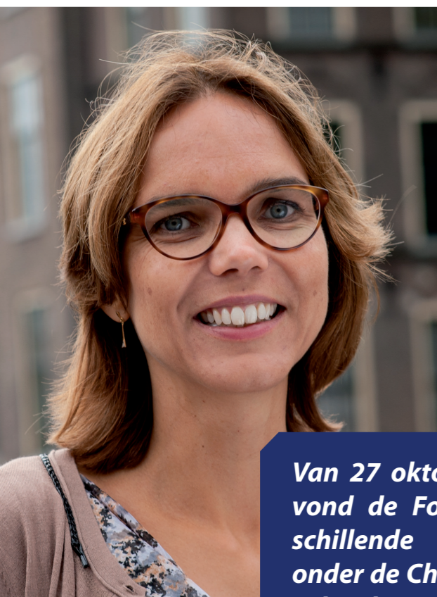
Tweede Kamerlid Carla Dik-Faber

Van 27 oktober tot 16 november vond de Foodbattle plaats. Verschillende organisaties, waaronder de ChristenUnie, riepen hun achterban op om de strijd aan te gaan tegen voedselverspilling. Drie weken lang werd bijgehouden welk voedsel in de container belandde en tussendoor kregen de deelnemers tips om dit te minderen. Volgens Tweede Kamerlid Carla Dik-Faber, initiatiefneemster binnen de ChristenUnie, gooit elke Nederlander gemiddeld 50 kilo eten weg op jaarbasis. Onder de Christen-Unie-deelnemers was het gemiddelde tijdens de Foodbattle slechts 13,5 kilo.